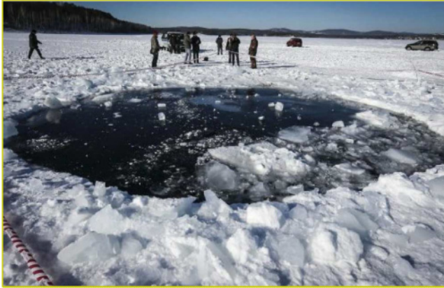
Nedslagsbullet i Chebarkul-søen