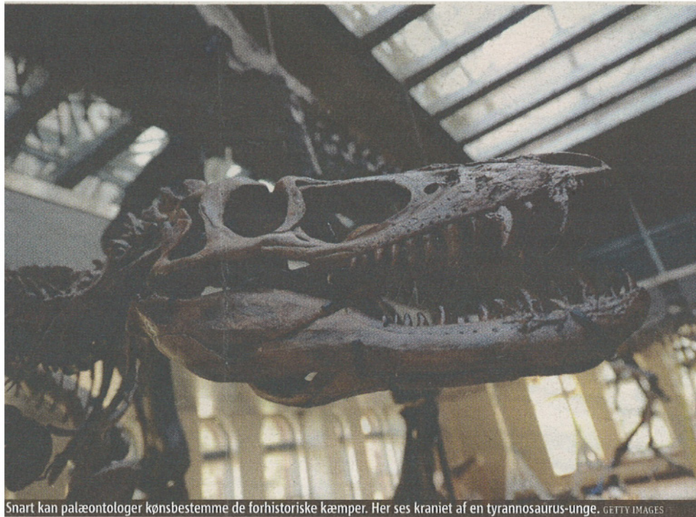
Snart kan palæontologer kønsbestemme de forhistoriske kæmper. Her ses kraniet af en tyrannosaurus-unge.

Fossiler af fugle hjælper forskere til at kønsbestemme dinosaurer.