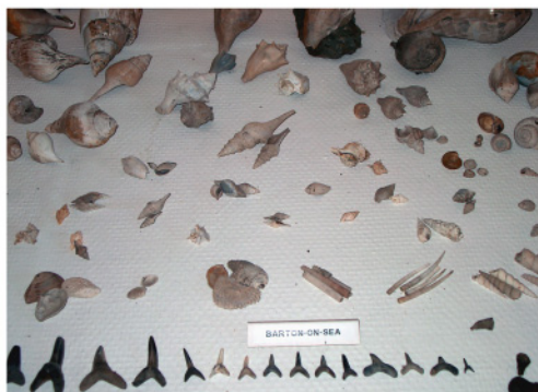
Blandede fossilfund fra Eocæn i England

”Vi har noget, der er over 300 millioner år gammelt, og det er du den første, der rører ved. Det synes jeg er fascinerende, og så er det også spændende at