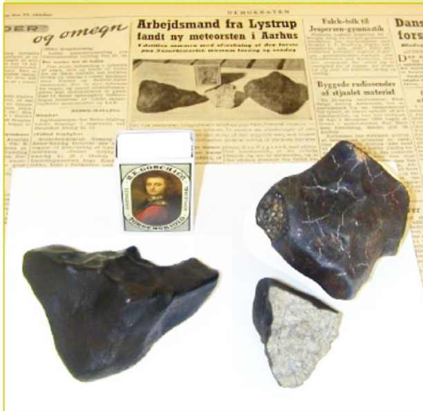
Aarhus meteoritterne oven på Demokraten fra 19. okt. 1951.