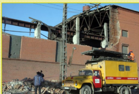
Skader på Zinkværket