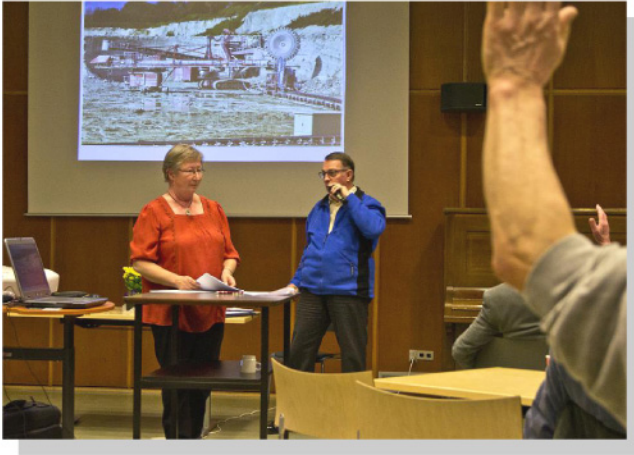
Kassereren og dirigenten får regnskabet godkendt.