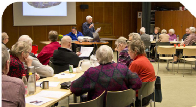
Formanden aflægger beretning

Så er det igen forår ifølge kalenderen, og der er tid til et tilbageblik over det forløbne år i Jysk Stenklub. Det er samtidigt det næstsidste møde, inden vores stensamleraktiviteter kommer rigtig i gang. Foråret giver mange glæder!