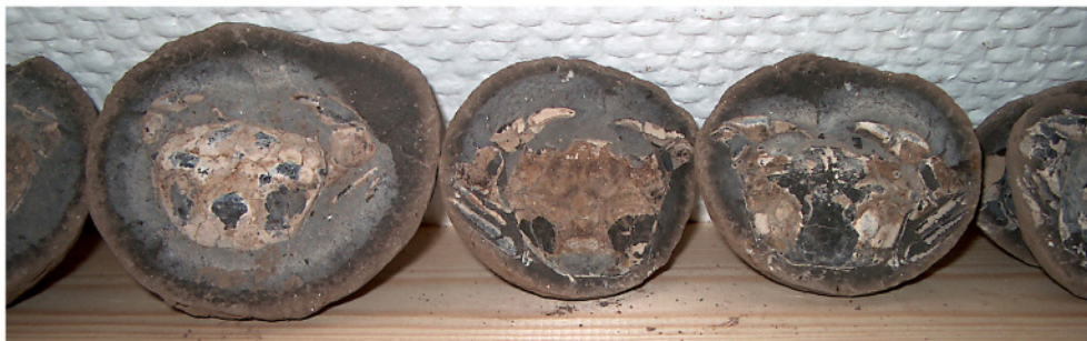
Krabber i rækkevis fra Lyby Strand

”Det er jagten! Det er ikke sjovt, hvis du kan stå og skovle op. Det gjorde vi ned ved De Gaulle lufthavnen i Frankrig. Der lå det sådan, at du tog med en skovl, og så skovlede du fossilerne op. Det gad jeg ikke!”